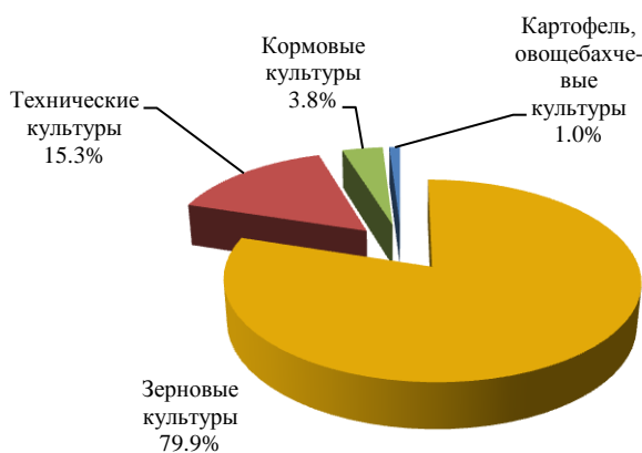
Структура посевных площадей сельскохозяйственных культур в хозяйствах всех категорий под урожай 2019г.

По предварительным данным, на 1 сентября текущего года завершена уборка зерна во всех категориях хозяйств. Собрано 7,8 млн. тонн зерна нового урожая (без кукурузы) в первоначально оприходованном весе, в том числе сельскохозяйственными организациями – 6,0 млн. тонн. Средняя урожайность зерновых культур составила 35,0 ц/га, что на 7,2% ниже уровня прошлого года.